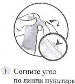
Рис.1 Для вскрытия саше используйте ножницы либо:

У пипетки, извлеченной из саше, откручивают кончик, раздвигают у животного шерсть в области спины (между лопатками) и, нажимая на пипетку, наносят препарат на кожу в одну или несколько точек (см. Рис. 1).