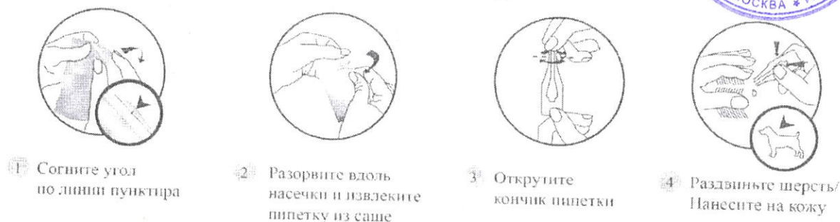
Рис.1 Для вскрытия саше не используйте ножницы либо:

У пипетки, извлеченной из саше, откручивают кончик, раздвигают шерсть животного в области спины (между лопатками) и, нажимая на пипетку, наносят препарат на кожу в одну или несколько точек (см. Рис. 1).